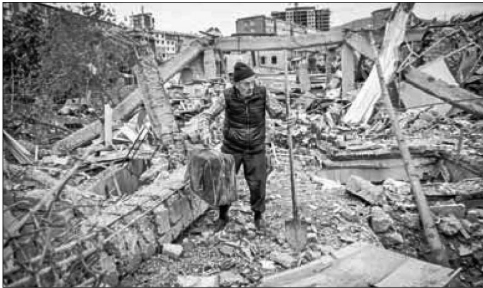
▲ Armenia y Azerbaiyán intercambiaron ayer acusaciones de ataques, pese al acuerdo de alto el fuego para detener combates por la región de Nagorno-Karabaj.