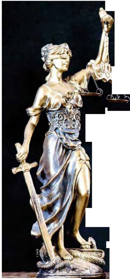
Más allá de lo abstracto.

y que en México no se acuse por conveniencia y exista, como valor universal, la presunción de inocencia. inocente valga más que la de un culpable confeso". Aclarado lo anterior, esta es la primera y la última vez que hablaré del tema fuera del juzgado. V “Pretendo que la voz de un